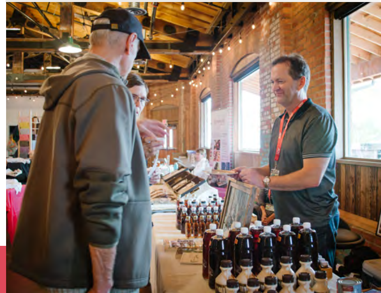
Kelowna Okanagan Market

La SDÉCB a organisé pour la première fois le Kelowna Okanagan Market. Pendant une journée, le 22 septembre, 34 entrepreneurs francophones et/ou francophiles de la région ont été invités à vendre leurs produits ou leurs services au public. L'événement a été un franc succès, et les entrepreneurs ont apprécié l'occasion de réseauter et de développer des occasions d'affaires.