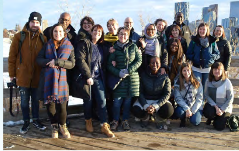
Table Tourisme de RDÉE Canada

Services d'informations à 291 visiteurs potentiels de la C.-B.