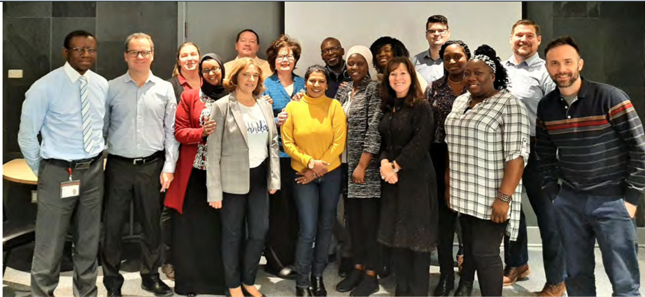
RDÉE Canada, Table nationale en immigration