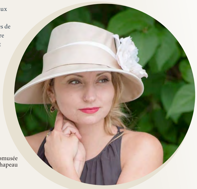
Économusée du chapeau

Refonte du site web des économusées et diffusion mensuelle d'une infolettre mettant en valeur les économusées de la province.