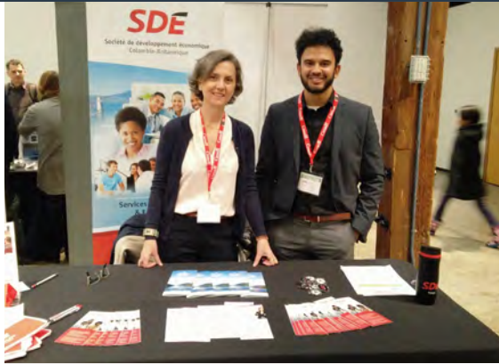
SIPE, Salon d'information pour les petites entreprises à Vancouver